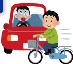
[倉敷市内での自転車事故件数]