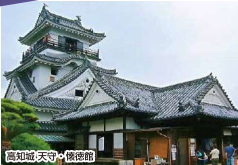
高知城 天守・懐徳館