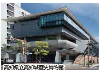
高知県立高知城歴史博物館