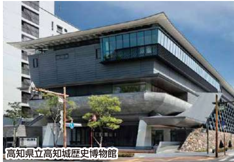
高知県立高知城歴史博物館

土佐の歴史と文化を堪能! 創建当時の姿を残す「高知城」と ニュースポット「高知城歴史 博物館」の入場券付♪