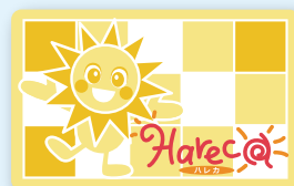
Hareca (岡山ローカルカード)